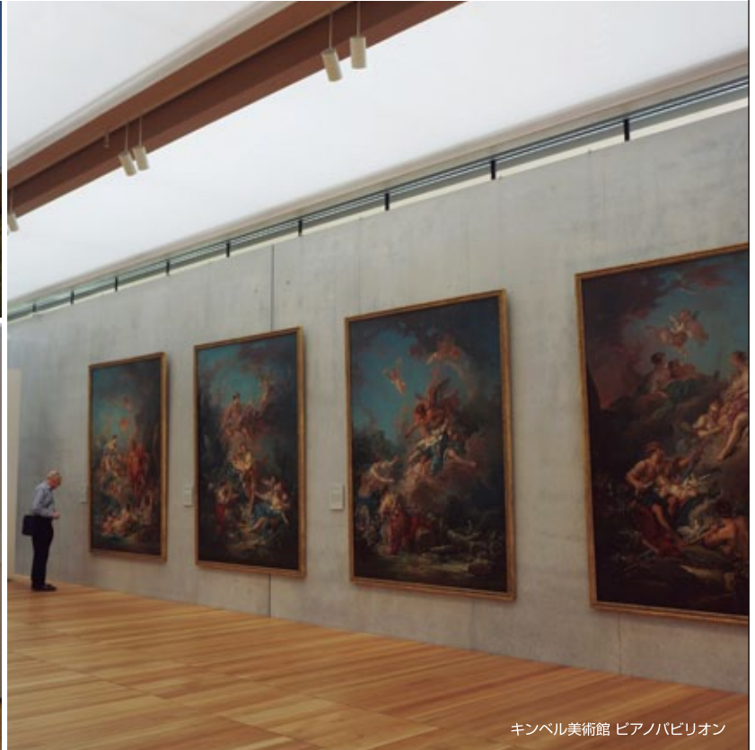
キンベル美術館 ピアナバリオ